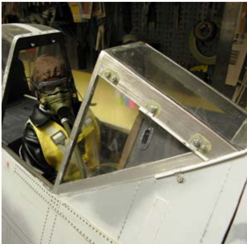
Luftwaffepilot in der cockpit.