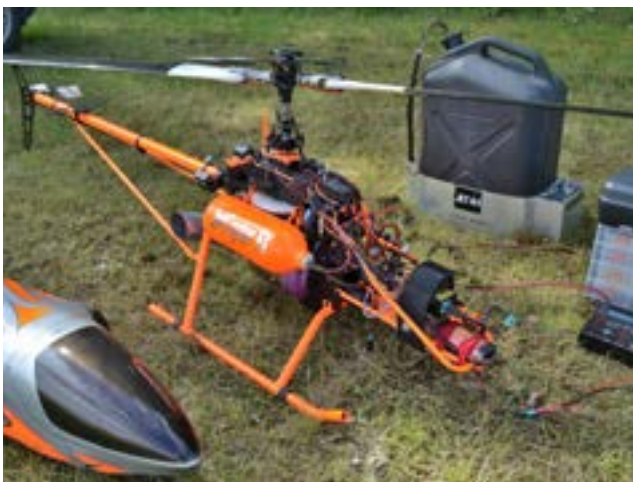
Tomas Leijon visade upp sin Jetcopter SX med hisnande prestanda. Gasturbinen ger 8 hk och kan snurra upp till 93000 rpm! Den dricker 1 liter bränsle på 7-8 minuter och kostar lika mycket som en småbil. Tomas är den femte ägaren till underverket.