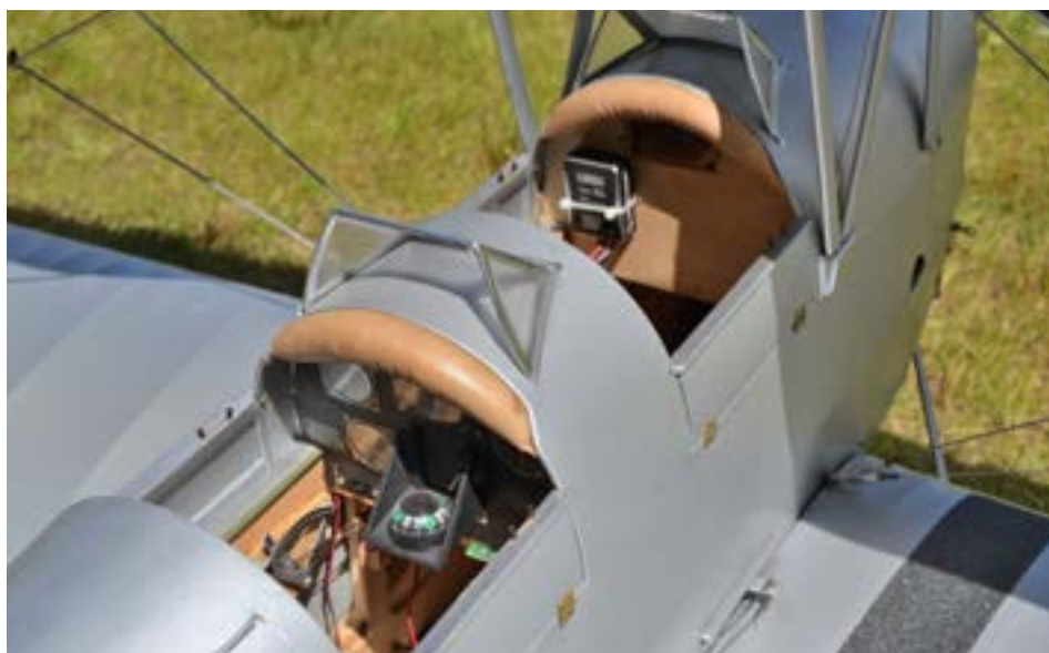
En mycket fin Tiger Moth kunde ses på NMKs meeting på Lundaskogsfältet i juli.