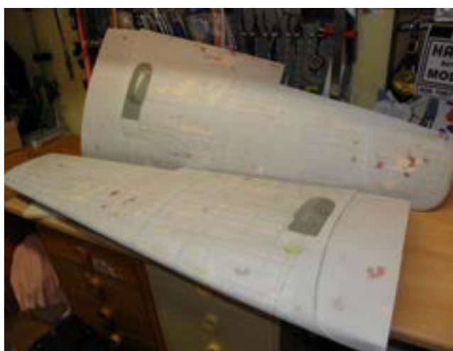
Nitar och skruvar klara på vingens översida.