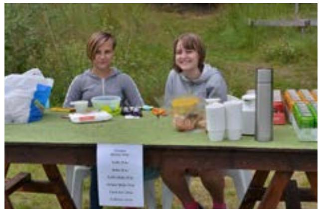
Kaffe, korv och dricka serverades av de här glada tjejerna.