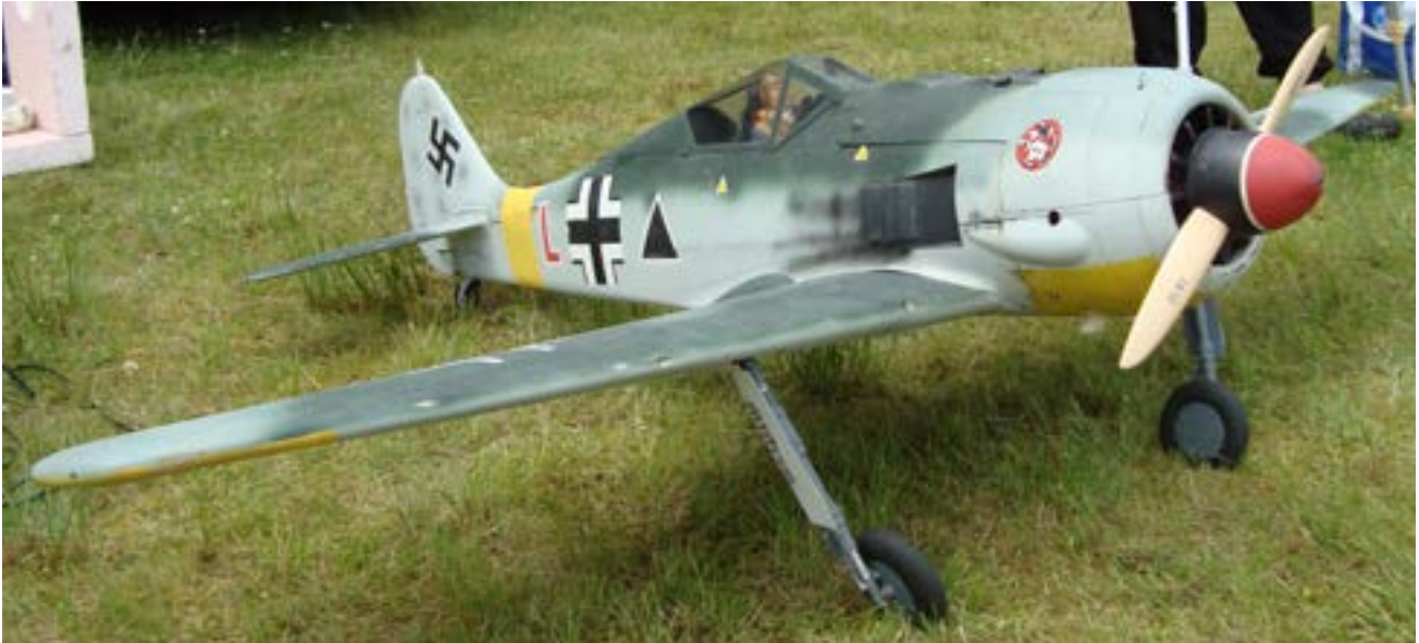
Christer L hade – förutom fru och dotter – med sig sin FW 190F2 som gjorde en fin uppvisning med rytande motor.