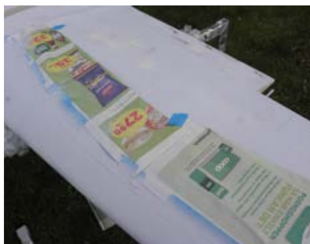
Skapar panellinjer i vårsolen.