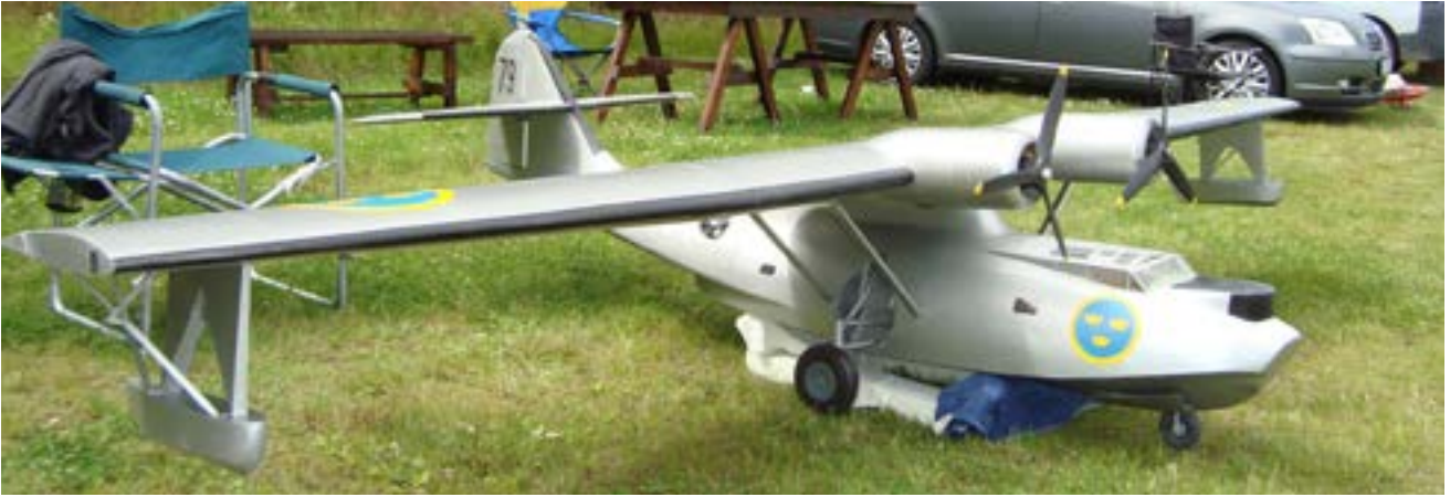
Sotarns Catalina är nu nästan klar för jungfrufärd. Ett otroligt fint bygge både till storlek och detaljering.