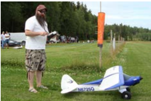
Sotarn taxar ut på fältet.

Den här kärran gick väldigt fort med skjutande propeller och har tydligen haft brutal markkontakt åtskilliga gånger! Den ärrade hjälten låg på biltaket färdig för hemtransport efter väl förrättat värv!