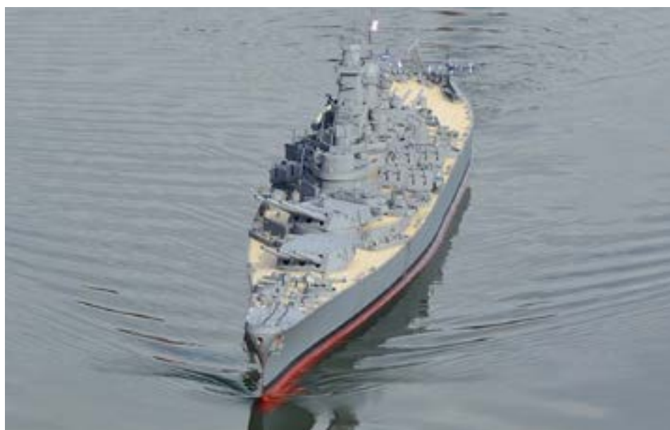
Georgs modell av USS Iowa är klart för drabbning och stävar fram i lugna vatten.